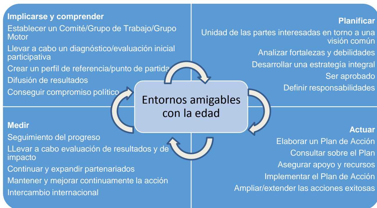
Imagen 2 - Pasos para crear entornos amigables con las personas mayores. El camino hacia entornos amigables con la edad requiere un proceso continuo de mejoras que debe tender a la dirección de las flechas. Diferentes actores pueden unirse en cualquiera de los pasos. El recorrido por las diferentes fases contará aproximadamente con 5 años para ser llevado a cabo.

• Medir : La recopilación de evidencia (datos contrastados) tanto en el progreso al implementar el enfoque amigable con la edad, como en su impacto en las vidas de las personas es crucial para el éxito y la sostenibilidad de los esfuerzos de una localidad para ser cada vez más amigables con las personas mayores. El seguimiento y la evaluación de los progresos ayudarán a identificar los éxitos y los retos, a proporcionar resultados que puedan ser comunicados a todos los interlocutores/actores locales implicados y servirán de base para definir prioridades para la acción futura. ( Resultado : Informes de seguimiento y evaluación)